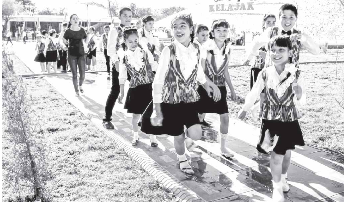
(Давоми. Бошланиши 1-бетда)

Юртбошимизнинг юқоридаги маърузалари барчамизни ўзимиз ва фарзандларимиз тақдирдан янада огоҳ бўлишга ундаб, айрим мурод қалбларни уйғотди, десак муболаға бўлмас. Буни жамиятимиз ҳаётига дахлдор бўлган мутасадди кишиларнинг қўйидаги фикрларидан ҳам билсак бўлади.