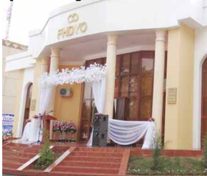
Дилмурод РУСТАМОВ, "Инсон ва қонун" муҳбири