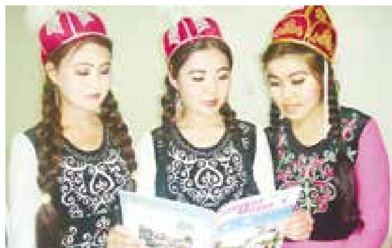
Муаллиф олган суратлар.