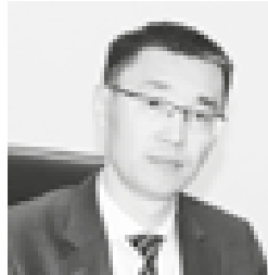
Есемурат КАНЬЯЗОВ , Адлия вазири ўринбосари, Тошкент давлат юридик университети ректори:

Президентимизнинг 2018 йил 13 апрелда “Давлат ҳуқуқий сиёсатини амалга оширишда адлия органлари ва муассасалари фаолиятини тубдан такомиллаштириш чора-тадбирлари тўғрисида”ги Фармони қабул қилинди.