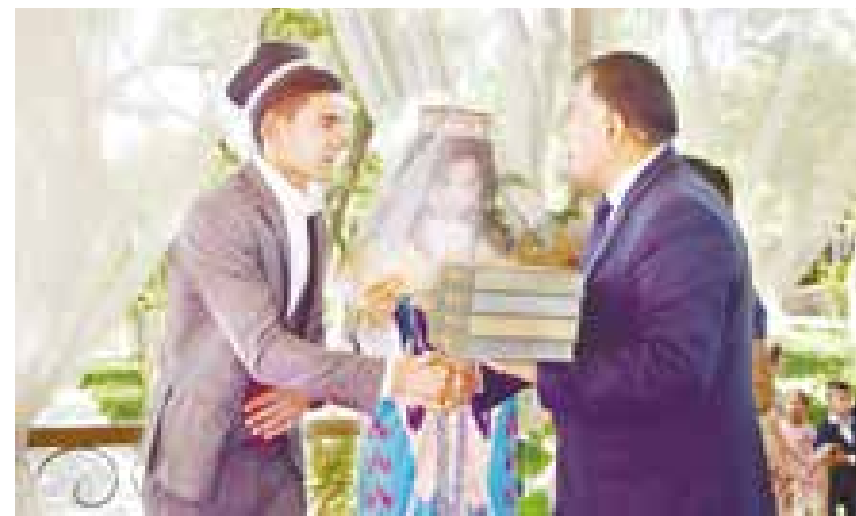
Келин-куёвга Навоий асарлари тўплами совға қилинди.