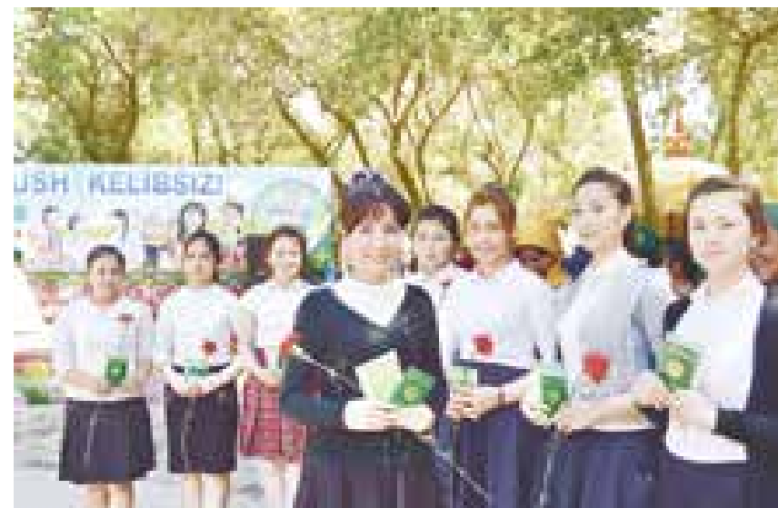
Ёшларга фуқаролик паспортлари топширилди.

ЮРТИМИЗДА янги ташаббуслар, янги ғоялар нафақат шаҳару марказлар, балки оқил ва чекка ҳудудларни ҳам қамраб олаётганлигига гувоҳимиз. Ўзбекистон Республикаси Адлия вазирлиги ташаббуси билан жойларда “Одилон қонунларни қабул қилиш, жамиятда қонунга ҳурмат руҳини қарор топтириш — демократик ҳуқуқий давлат қуришнинг гаровидир”, деган концептуал ғояни ҳаётга татбиқ этиш, аҳолининг ҳуқуқий онги ва ҳуқуқий маданиятини янада ошириш ҳамда қонунийликни мустаҳкамлашга қаратилган ҳуқуқий тарғибот ва маърифат тадбирлари ўтказилаётганлиги фикримизнинг ёрқин далилидир.