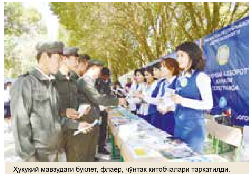
Қуқуқий мавзудаги буклет, флаер, чўнтак китобчалари тарқатилди.