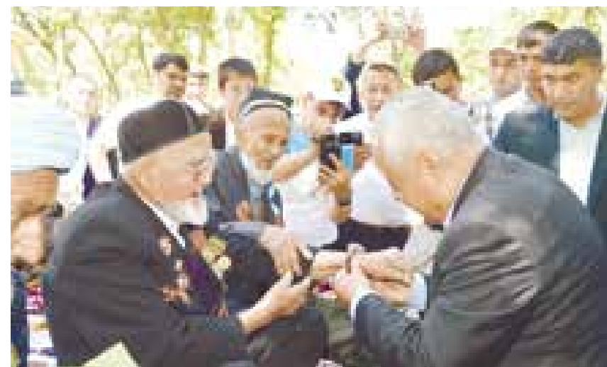
Иккинчи жаҳон уруши қатнашчиларига эҳтиром кўрсатилди.