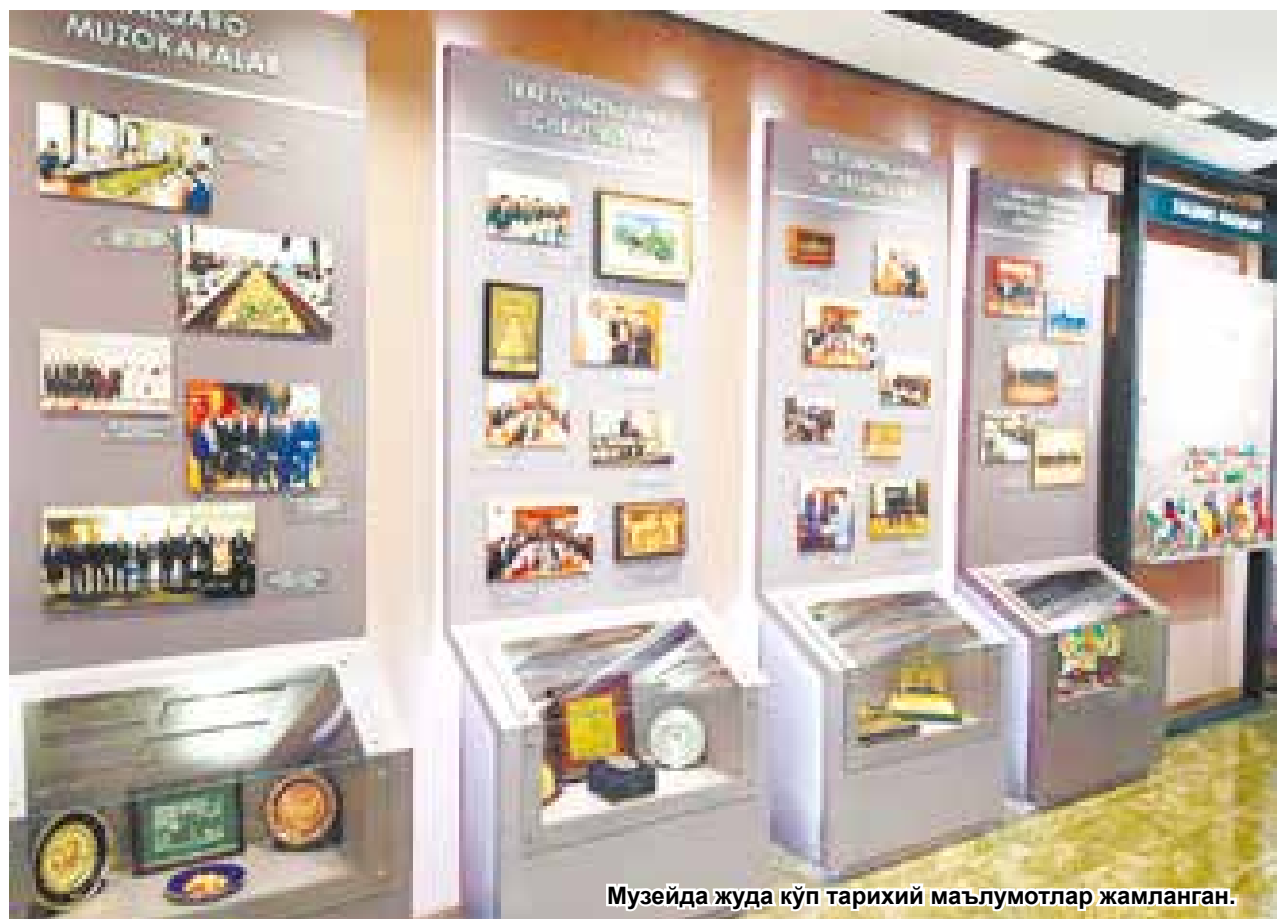
Музейда жуда кўп тарихий маълумотлар жамланган.

Адлия органлари тарихи музейининг очилиш маро-